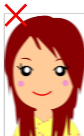
⊗照片解析度不夠(太模糊)