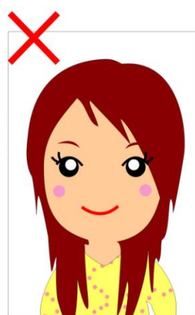
⊗頭頂至下巴的高未佔整張照片寬的2/3以上