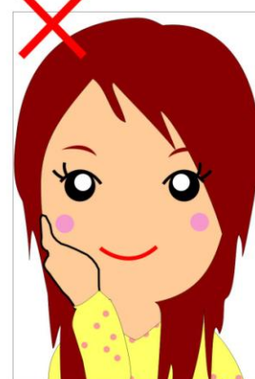
⊗臉部不可被遮住(被手遮住)