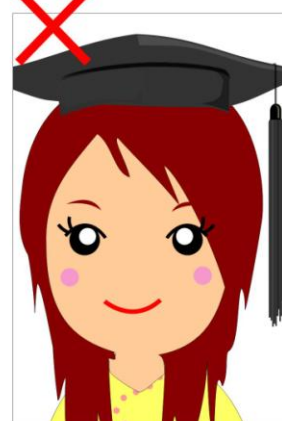
⊗載著學士帽或其他帽子拍照