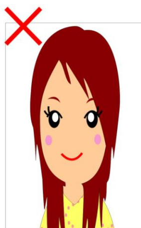
⊗照片變型，寬與長比例非2:3