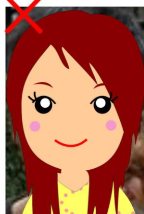
⊗背景非白色或淺色